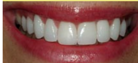
Auch die ästhetische Komponente gehört zum Portfolio. Foto: Professionelles Bleaching für weiße Zähne und ein schönes Lächeln.